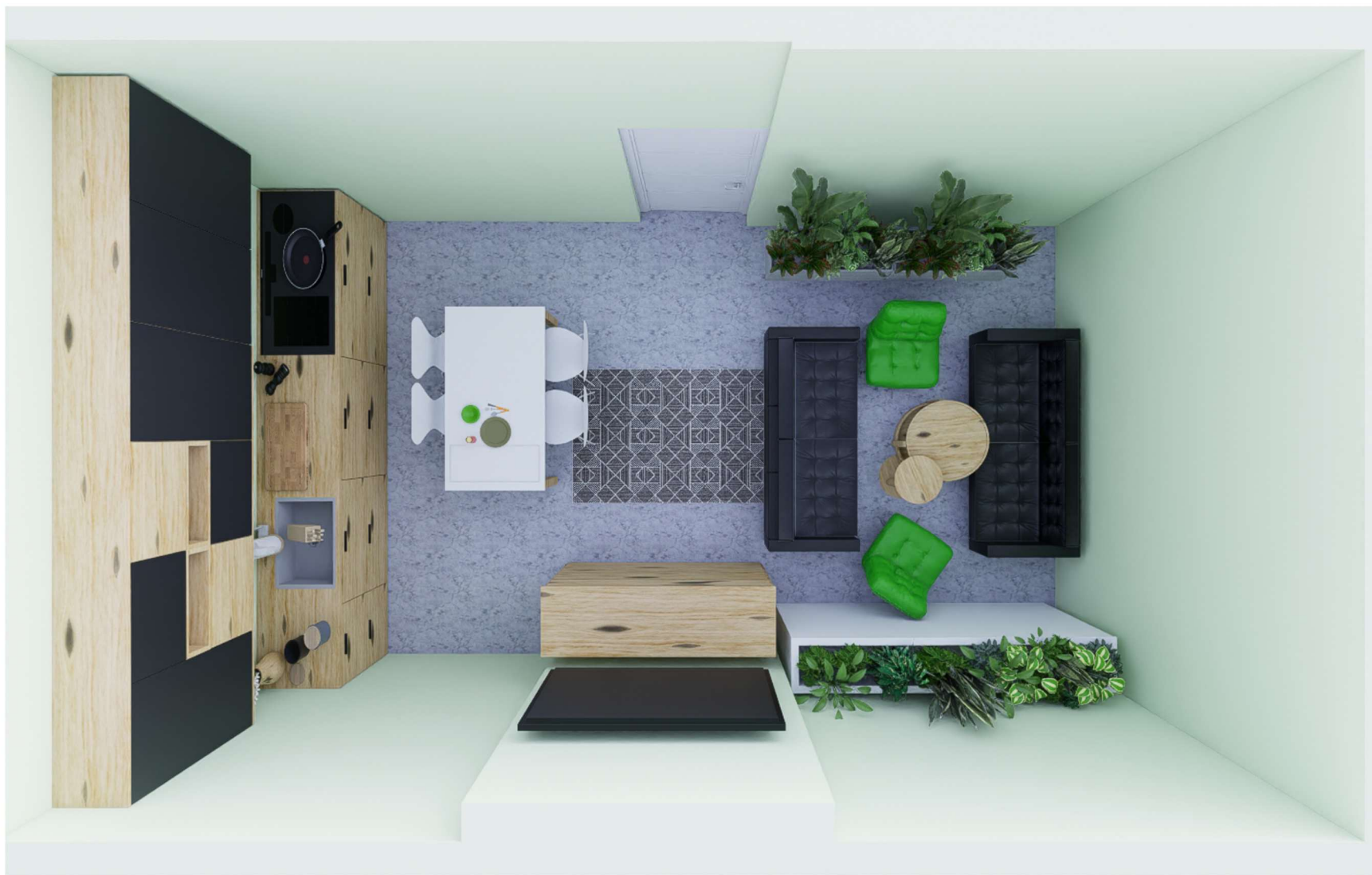
POMIESZCZENIE 08 WIDOK Z GÓRY, STREFA POBYTU DZIENNEGO PACJENTA