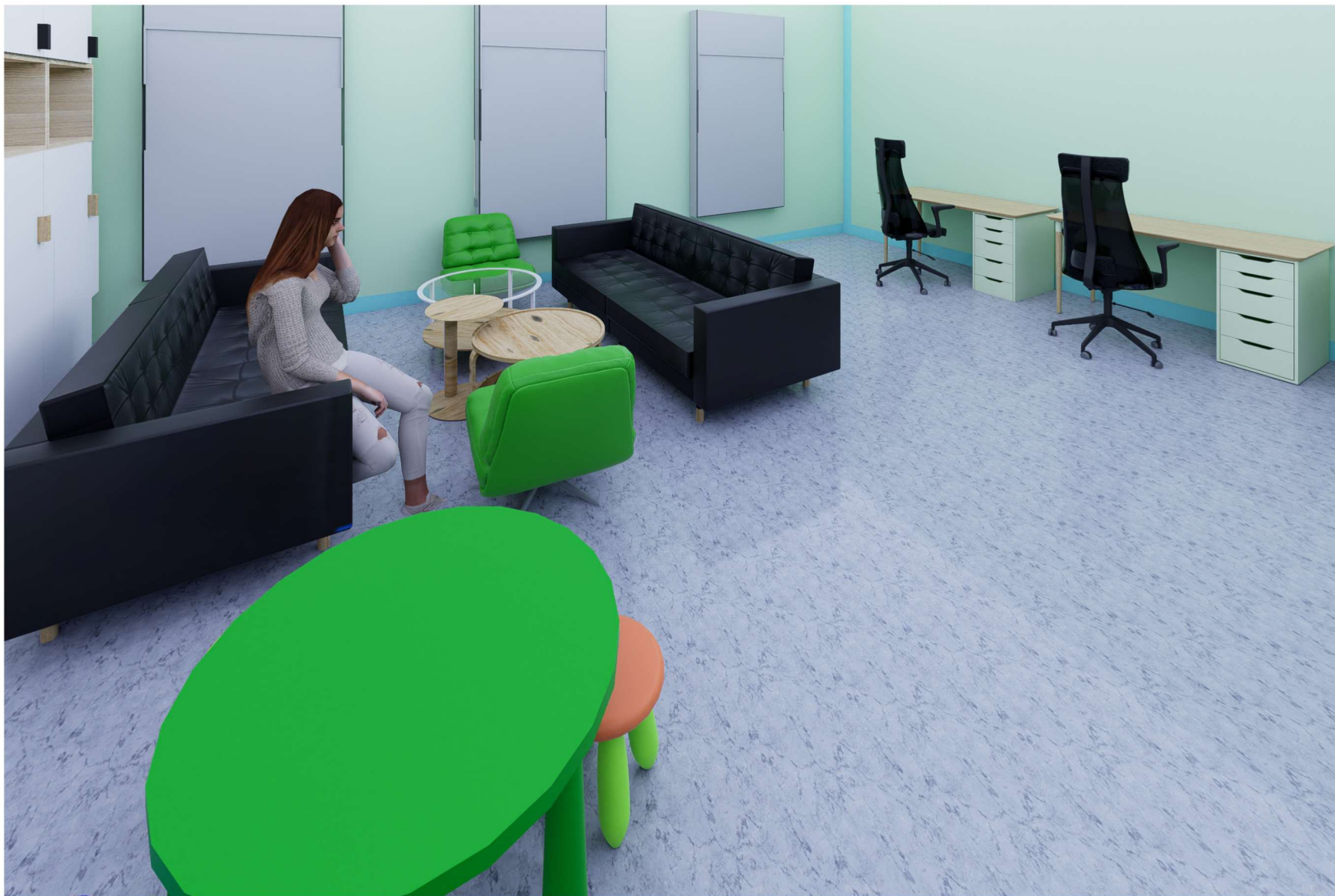
STREFA ODPOCZYNKU ORAZ KĄCIK DLA DZIECI

WOJEWÓDZKI SZPITAL ZESPOŁONY W PŁOCKU UL. MEDYCZNA 19 09-400 PŁOCK