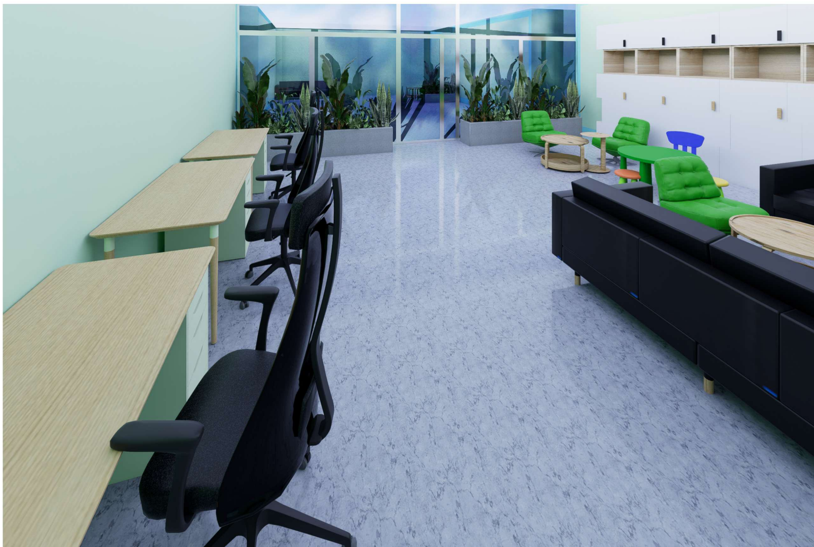
POMIESZCZENIE NUMER 02 WIDOK NA STREFĘ PRACY ORAZ SPOTKAŃ Z RODZINĄ