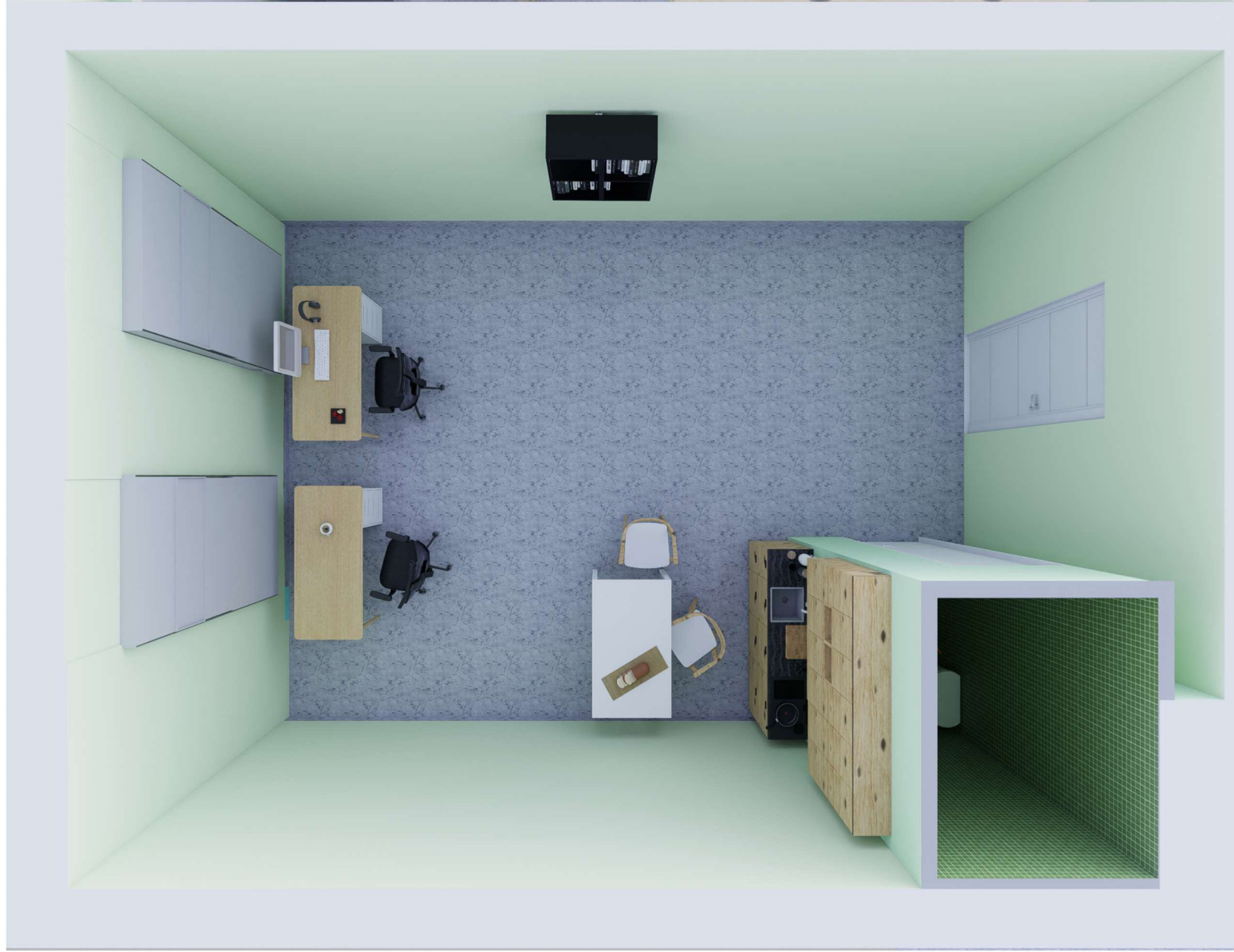
POMIESZCZENIE 03 -WIDOK Z GÓRY