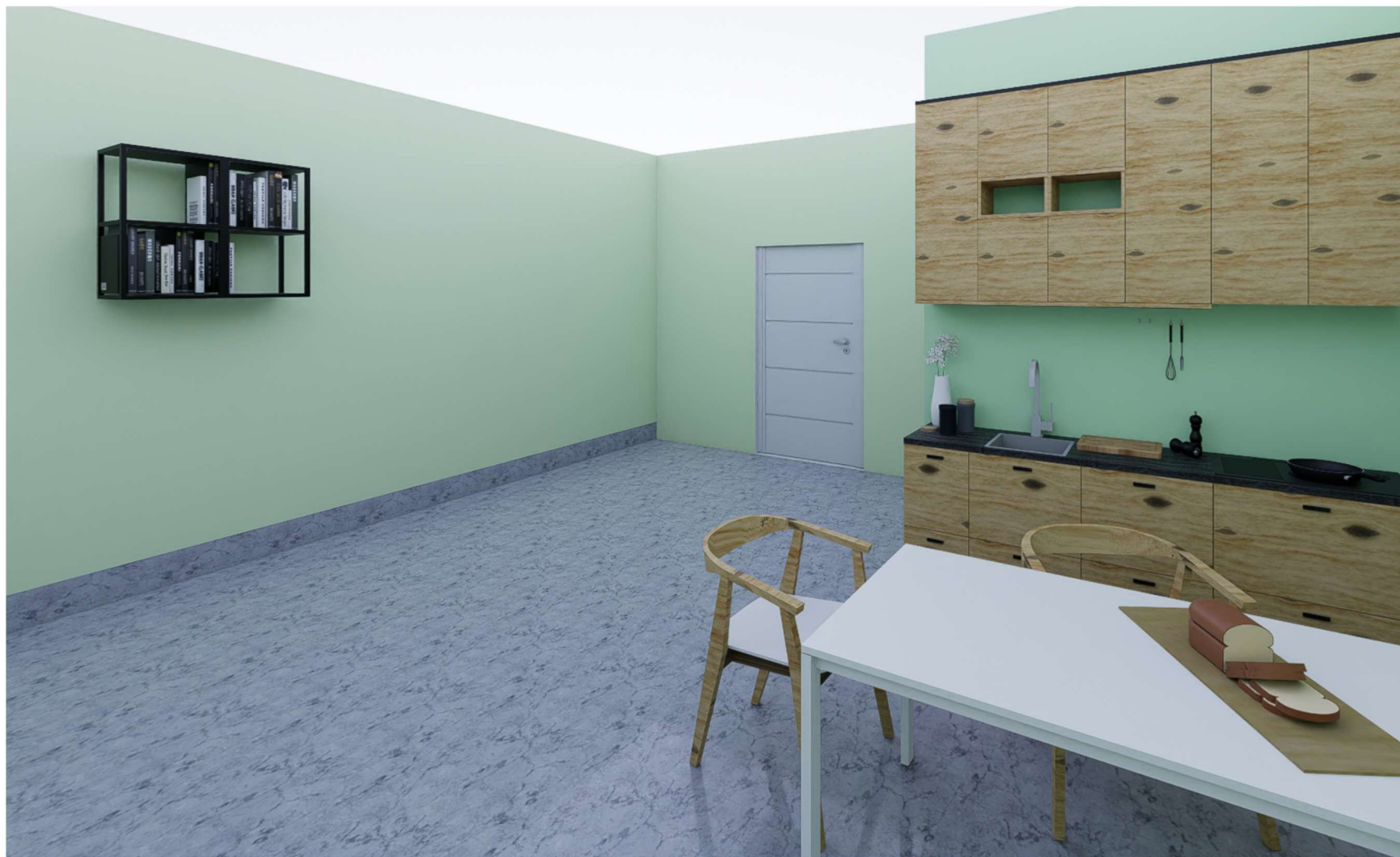
POMIESZCZENIE NUMER 05 WIDOK NA ANEKS KUCHENNY

WOJEWÓDZKI SZPITAL ZESPOŁONY W PŁOCKU UL. MEDYCZNA 19 09-400 PŁOCK