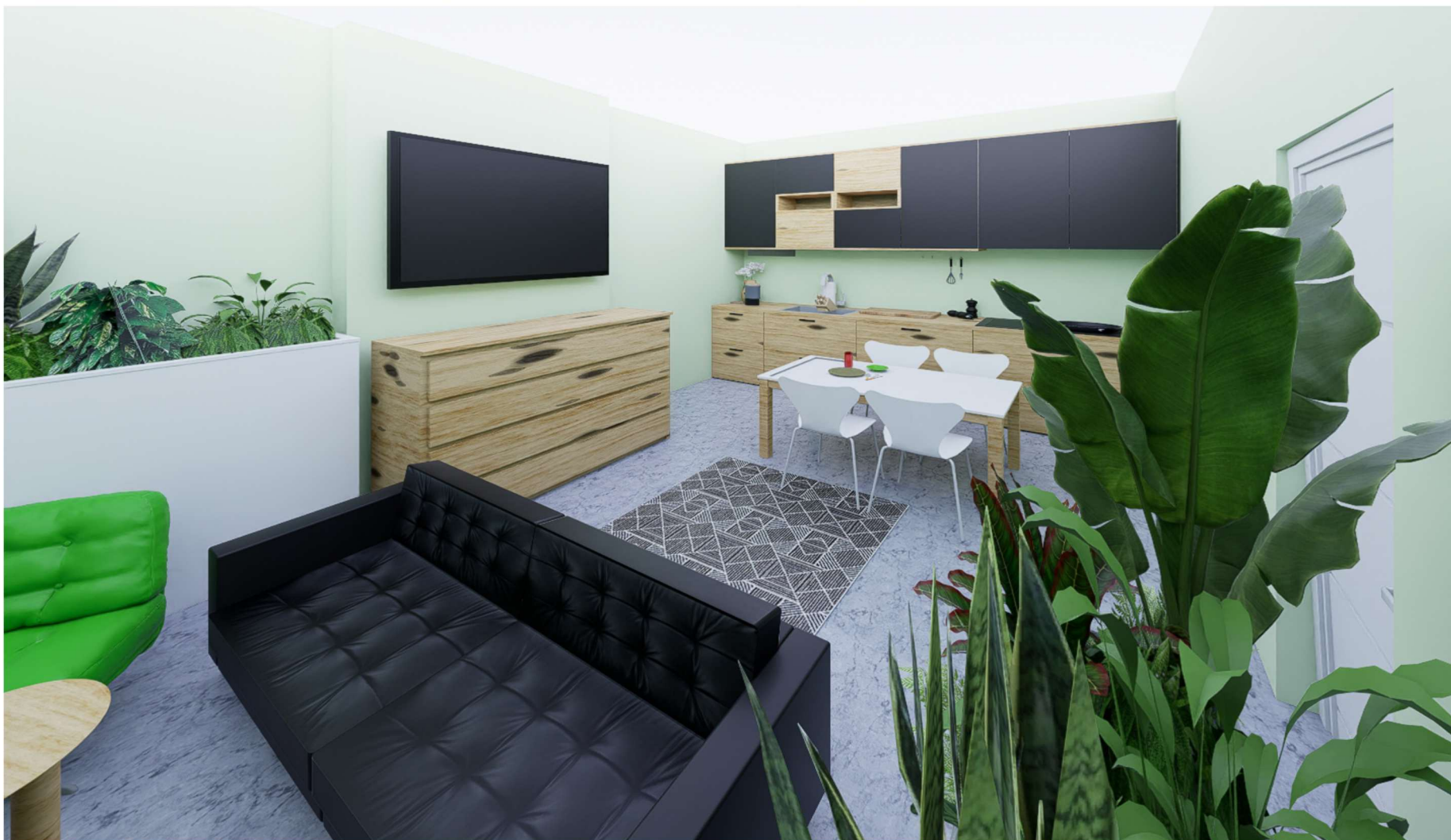
POMIESZCZENIE NUMER 08 WIDOK NA ANEKS KUCHENNY ORAZ STREFĘ WYPOCZYNKU

WOJEWÓDZKI SZPITAL ZESPOŁONY W PŁOCKU UL. MEDYCZNA 19 09-400 PŁOCK