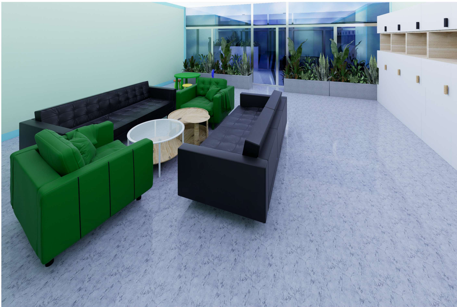
POMIESZCZENIE NUMER 02.II WIDOK NA STREFĘ SPOTKAŃ Z RODZINĄ ORAZ ZABUDOWANĄ BIBLIOTECZKĘ