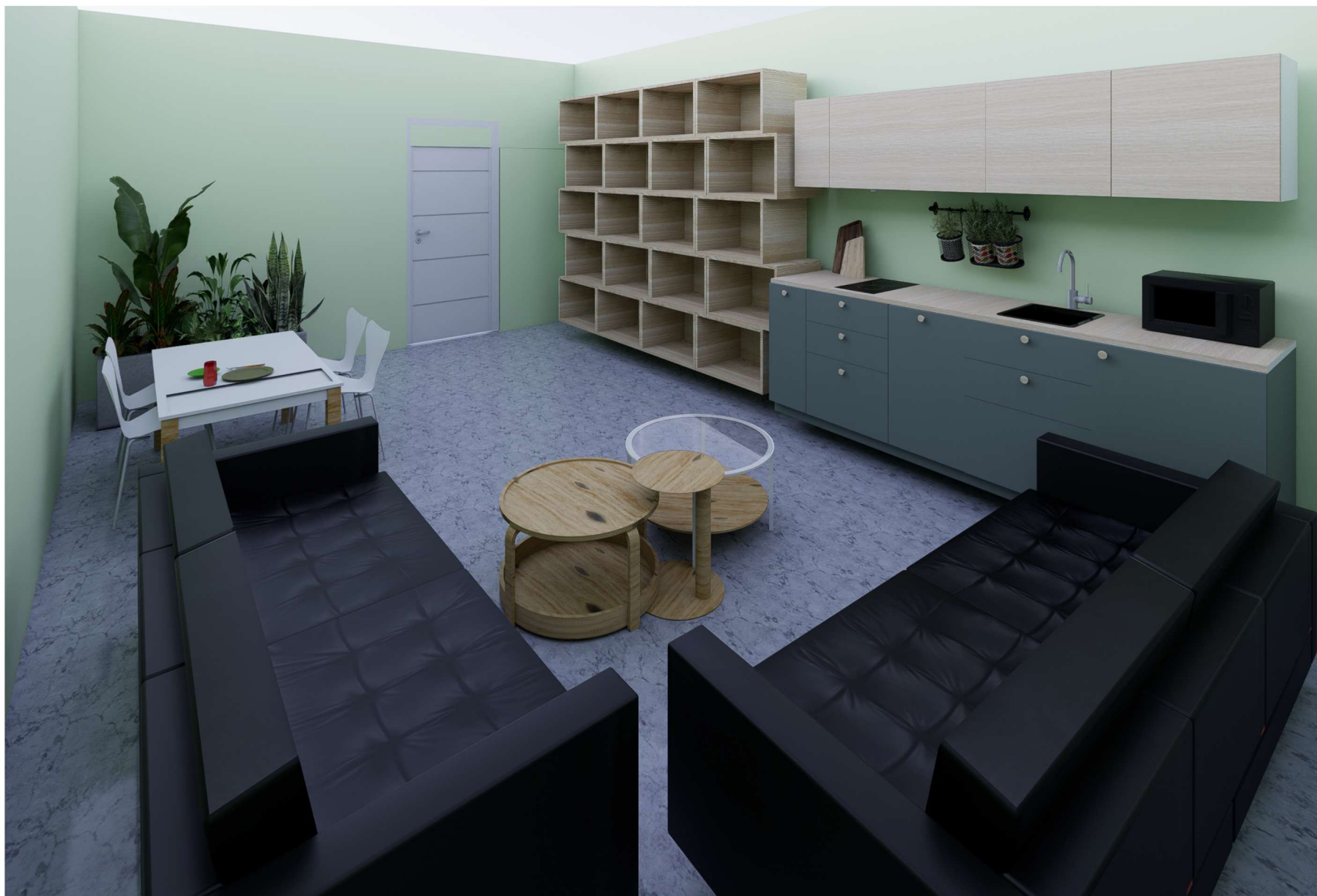
POMIESZCZENIE NUMER 07

WOJEWÓDZKI SZPITAL ZESPÓŁONY W PŁOCKU UL. MEDYCZNA 19 09-400 PŁOCK