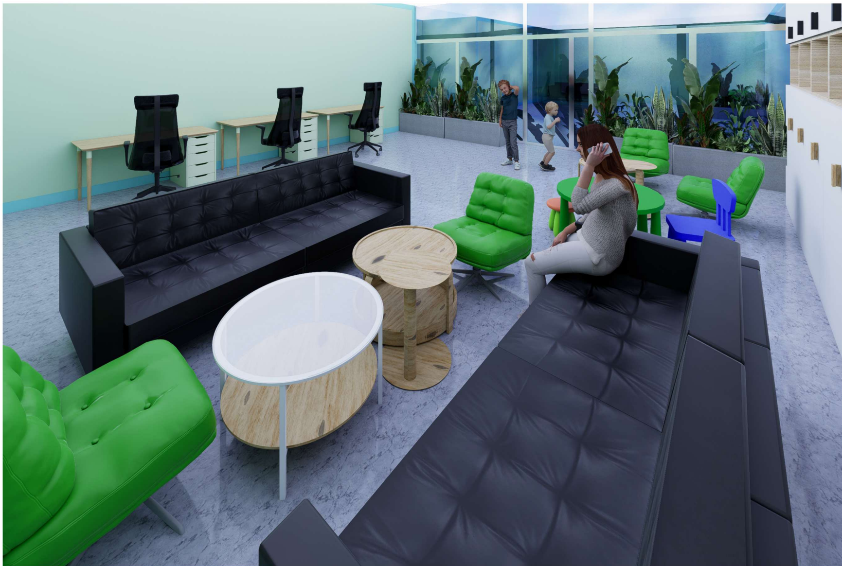
POMIESZCZENIE NUMER 02 WIDOK STREFY ODPOCZYNKU ORAZ SPOTKAŃ Z RODZINĄ

WOJEWÓDZKI SZPITAL ZESPOŁONY W PŁOCKU UL. MEDYCZNA 19 09-400 PŁOCK