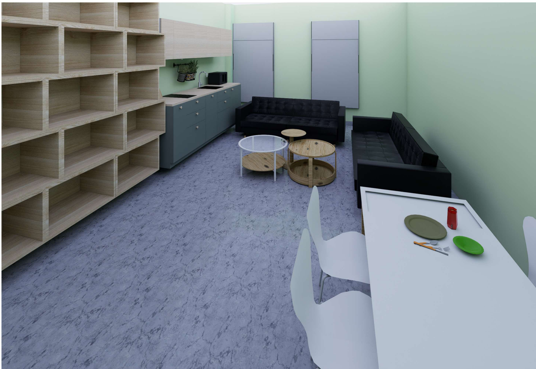
POMIESZCZENIE NUMER 06 WIDOK NA STREFĘ RELASKI ORAZ ANEKS KUCHENNY

WOJEWÓDZKI SZPITAL ZESPOŁONY W PŁOCKU UL. MEDYCZNA 19 09-400 PŁOCK