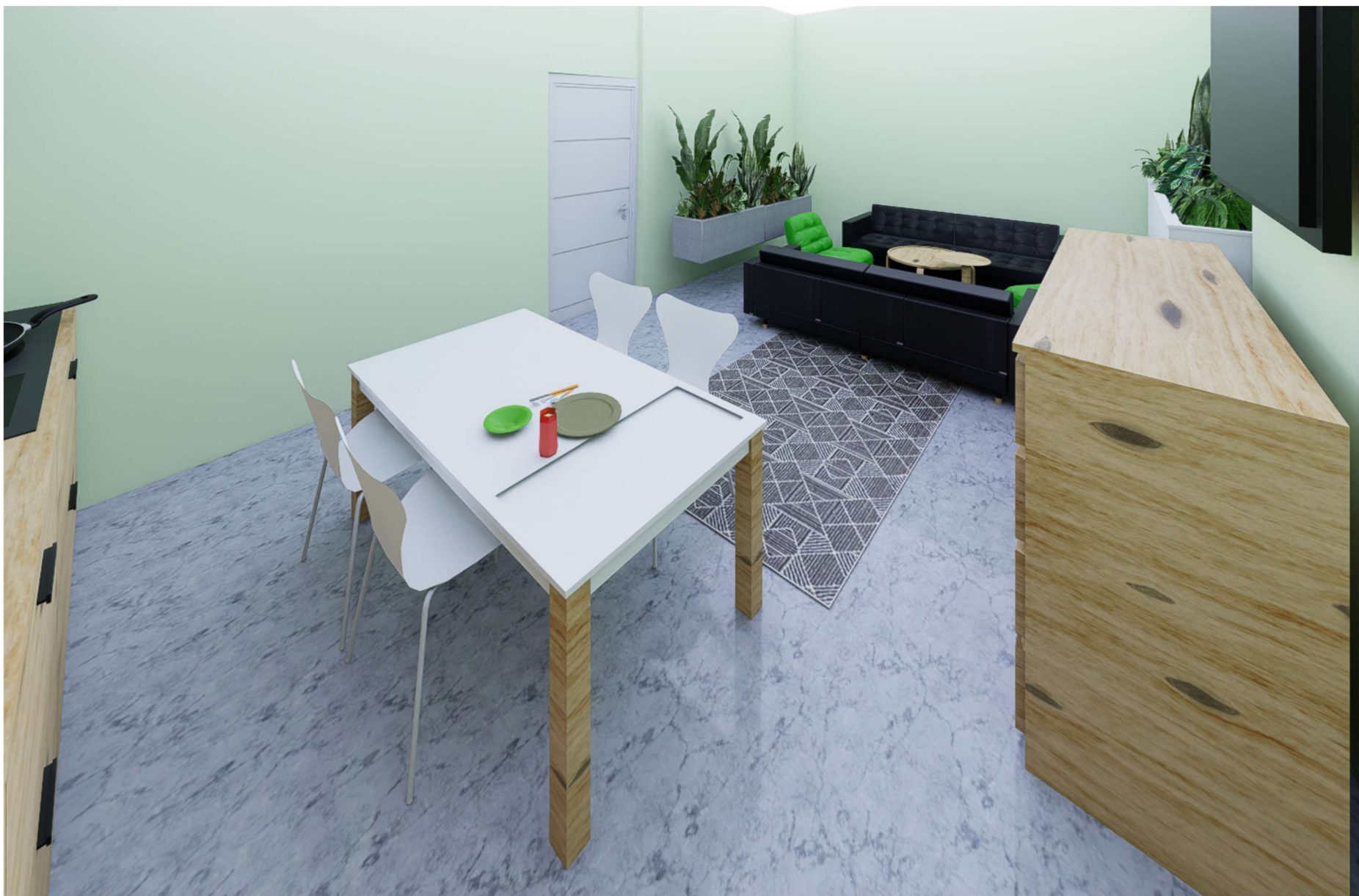
POMIESZCZENIE NUMER 08 WIDOK STREFY WYPOCZYNKOWEJ ORAZ JADALNIANEJ

WOJEWÓDZKI SZPITAL ZESPOŁONY W PŁOCKU UL. MEDYCZNA 19 09-400 PŁOCK