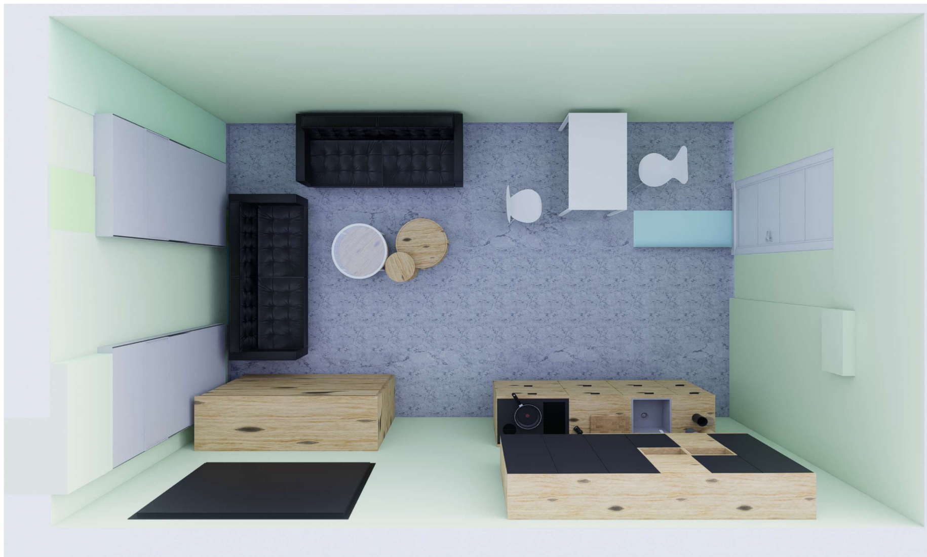
POMIESZCZENIE NUMER O6 -STREFA RELAKSU-WIDOK Z GÓRY