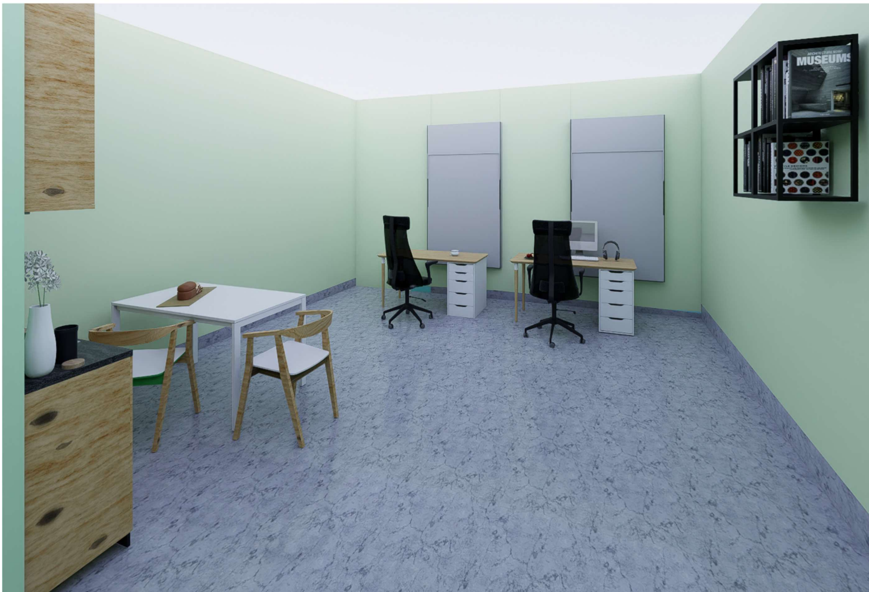
POMIESZCZENIE NUMER 04 WIDOK NA STREFĘ PRACY CICHEJ

WOJEWÓDZKI SZPITAL ZESPOŁONY W PŁOCKU UL. MEDYCZNA 19 09-400 PŁOCK